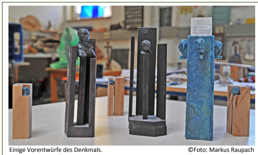
Einige Vorentwürfe des Denkmals.